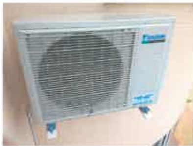
Ad 12 Klima uređaj DAIKIN