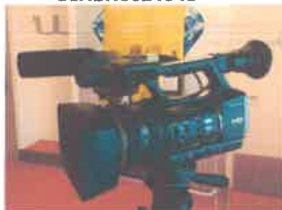
Ad 4 Kamera SONY ser.br.0021343